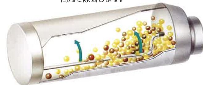
※写真・イラストはイメージです。

ポンプはエコノミー、ノーマル、ジェットの3段階切り換えが可能。ジェット運転では快適な気泡水流がお楽しみいただけ、夜間などはエコノミー運転を行うことでポンプの電気代を約半分に抑えてとても経済的です。